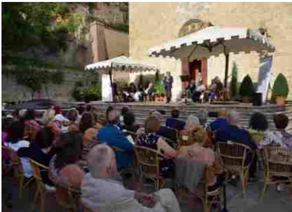
Premio Cetonaverde, scorsa edizione