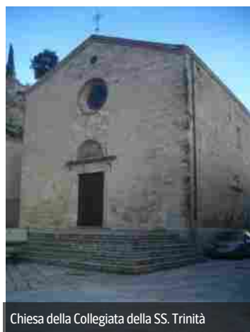
Chiesa della Collegiata della SS. Trinità