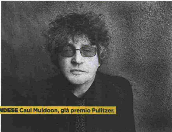
IRLANDESE Paul Muldoon, già premio Pulitzer.